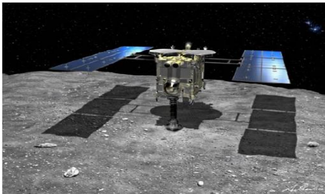
はやぶさ2の「リュウグウ」表面着地のイラスト (池下章裕氏 JAXA)

JAXAのホームページを覗いてみると、この「はやぶさ」の惑星探査の科学的意義は、「我々はどこから来たのか」という根源的な疑問を解決することとしている。持ち帰った試料・資料を分析し、太陽系の起源・進化の解明や生命の原材料物質が解き明かされて行くのである。