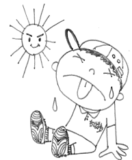
夏のウォーキングは気を付けて!!

水分補給は、みんなへのアドバイスです。自分は大丈夫と思っても、折角のお言葉です。付き合いドリンクと塩分補給を。好みに合わせた水・麦茶・スポーツ飲料を用意しよう。