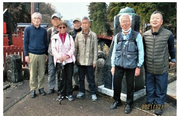
旅の無事を感謝して(神橋前)

杉並木を過ぎ「JR日光駅、東武日光駅」付近に着く。ここが最後の宿場町「鉢石宿」である。緩やかな上り坂を登りきると表参道、ゴールだ。大谷川に架かる朱色の「神橋」金谷旅館前で記念撮影した後、近くの店で日光名物・湯波蕎麦で昼食をとる。此处でめでたく打上げ、解散とした。