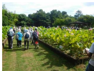
東大旧緑地植物園

テスト実施としては成功だったと思います。秋以降にのんびりウォークを実施していきますので、多くの皆様のご参加をお待ちしております。